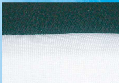
【パールマイン 50回洗濯後】